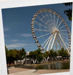
Montréal Ferris Wheel