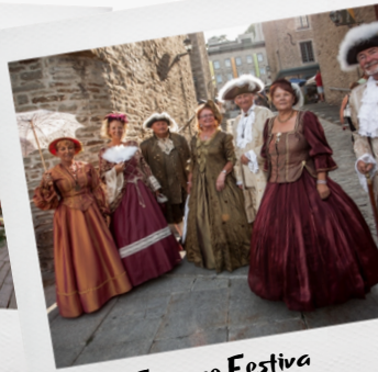
New France Festival